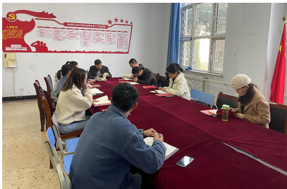
图 1 学院开会安排部署“开学第一课”

根据《山西省委教育工委 山西省教育厅 关于贯彻学习习近平总书记考察调研山西重要指示精神 在全省学校上好 2022 年春季学期“开学第一课”的通知》（晋教工委宣〔2022〕1号）和《中共运城职业技术学院委员会 关于学习贯彻习近平总书记考察调研山西重要指示精神 在全校上好 2022 年春季学期“开学第一课”的通知》（运职院党〔2022〕5号）文件要求，建筑工程学院在开学工作会议上组织全院教师认真学习文件精神，并于 2 月 27 日以教研室为单位召开“开学第一课”专题教研活动，大家集思广益、集体备课、制作讲课课件，将习近平总书记考察调研山西重要指示精神与建筑行业发展相结合，于 2 月 28 日至 3 月 4 日开课第一周在全院所有教学班进行了“开学第一课”。