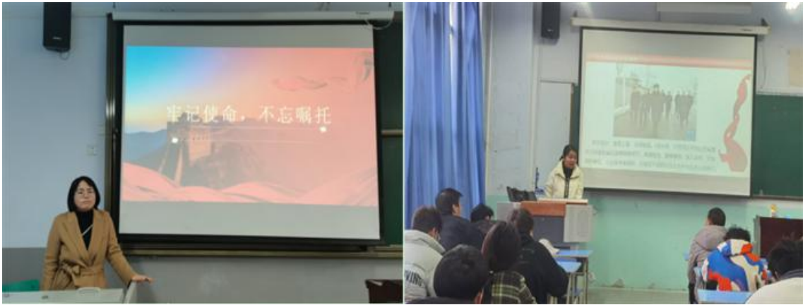
组图 4 专业课教师讲“开学第一课”