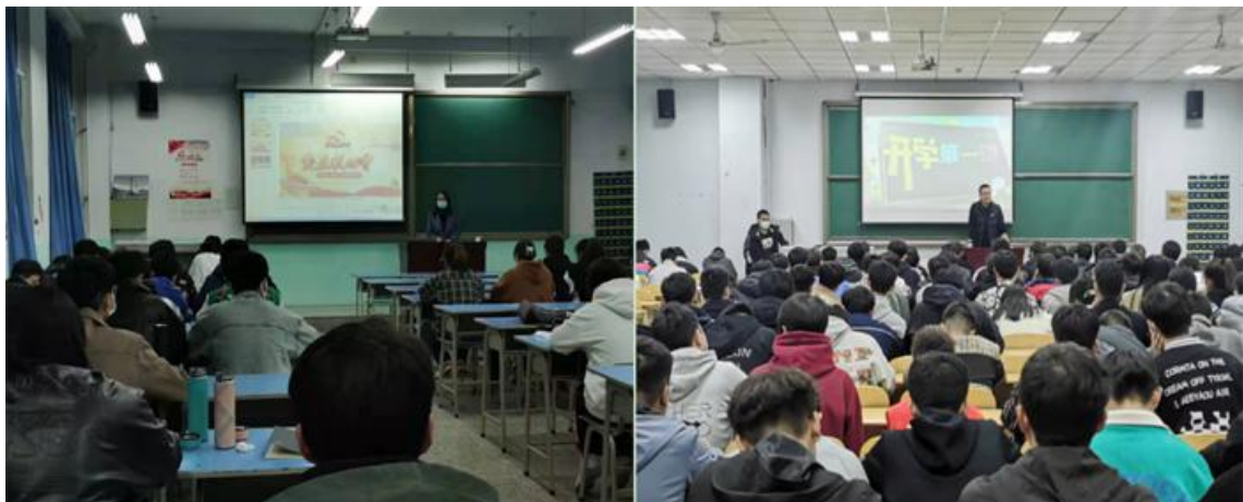
图 3 辅导员老师召开主题班会讲“开学第一课”

辅导员老师们充分利用晚自习时间，以主题班会和主题团日活动的形式组织各班认真学习习近平总书记考察调研山西重要指示精神。班会中，辅导员老师从“学习习近平总书记山西行纪实”“感悟习近平总书记山西行”“践行习近平总书记嘱托”三个部分为大家讲述了总书记访山西各地考察调研实录，详细了解了总书记深入农村、文物保护单位、企业等，为基层干部群众送去党中央的关心和慰问情况；重点解读了总书记“我将无我、不负人民”的精神境界，实事求是、求真务实的工作作风，主动担当、积极作为的工作态度；教育引导同