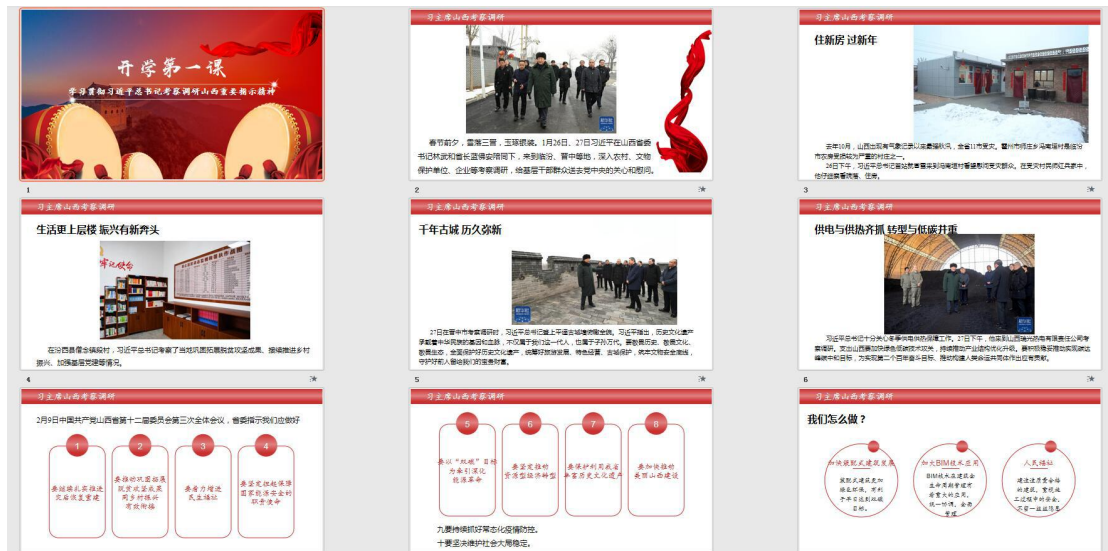
图 2 教研活动教师集体备课制作“开学第一课”课件